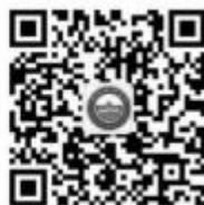
校园网官方公众号